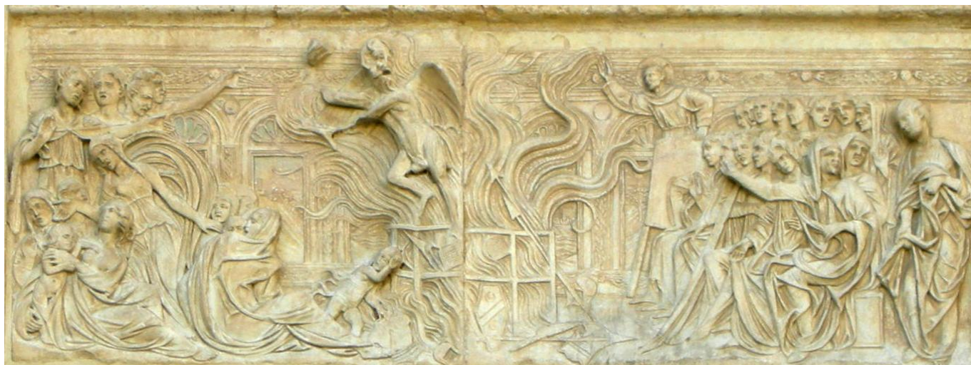
Na obrázku Bernardin a talamo , tj. „hranice marnosti“, z níž vylétá ďábel.

Po kazatelském cyklu v Pratu se Bernardin zřejmě vydal do Říma. Sekretář senátu Stefano Infessura (c. †1500) vypráví, že byla na Kapitolu vztyčena obrovská hranice nazývaná talamo , v níž byly různé předměty her (karty apod.), hudební nástroje, ženské paruky a jiné ozdoby a vše bylo spáleno. Později, 8. července, byla upálena čarodějnice Finicella, která podle Infessury „ ďábelsky zabila mnoho tvorů a očarovala mnoho lidí, a celý Řím se na to šel podívat “. V kronice autor jménem Paolo dello Mastro (ovšem s chybou v roce, místo 1424 uvádí 1442) píše: