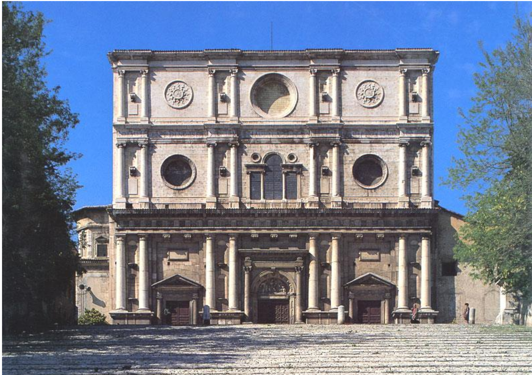
Bazilika sv. Bernardina v Aquile, kde je pohřben.